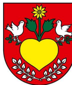
Obrázok 2 Erb obce

Erb obce Okružná tvoria v červenom štíte dva strieborné privrátené holuby - ľavý ohliadajúci sa - stojaci na zelených odvrátených vetvičkách, vyrastajúcich z bokov zlatého, zdola dvoma striebornými vetvičkami plytko ovenčeného veľkého srdca so zlatým, na zelenej listnatej stopke vyrastajúcim kvetom.